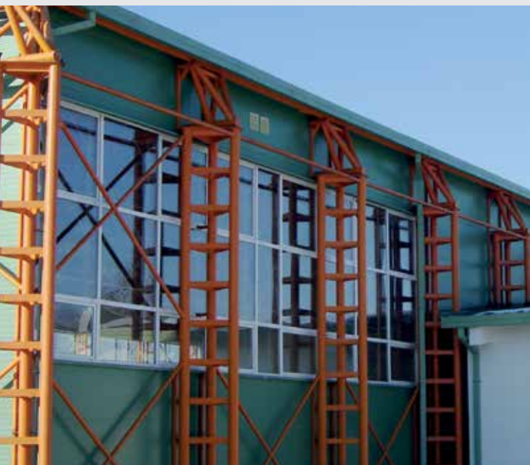
Săli de sport | Gyms | Diverse locații